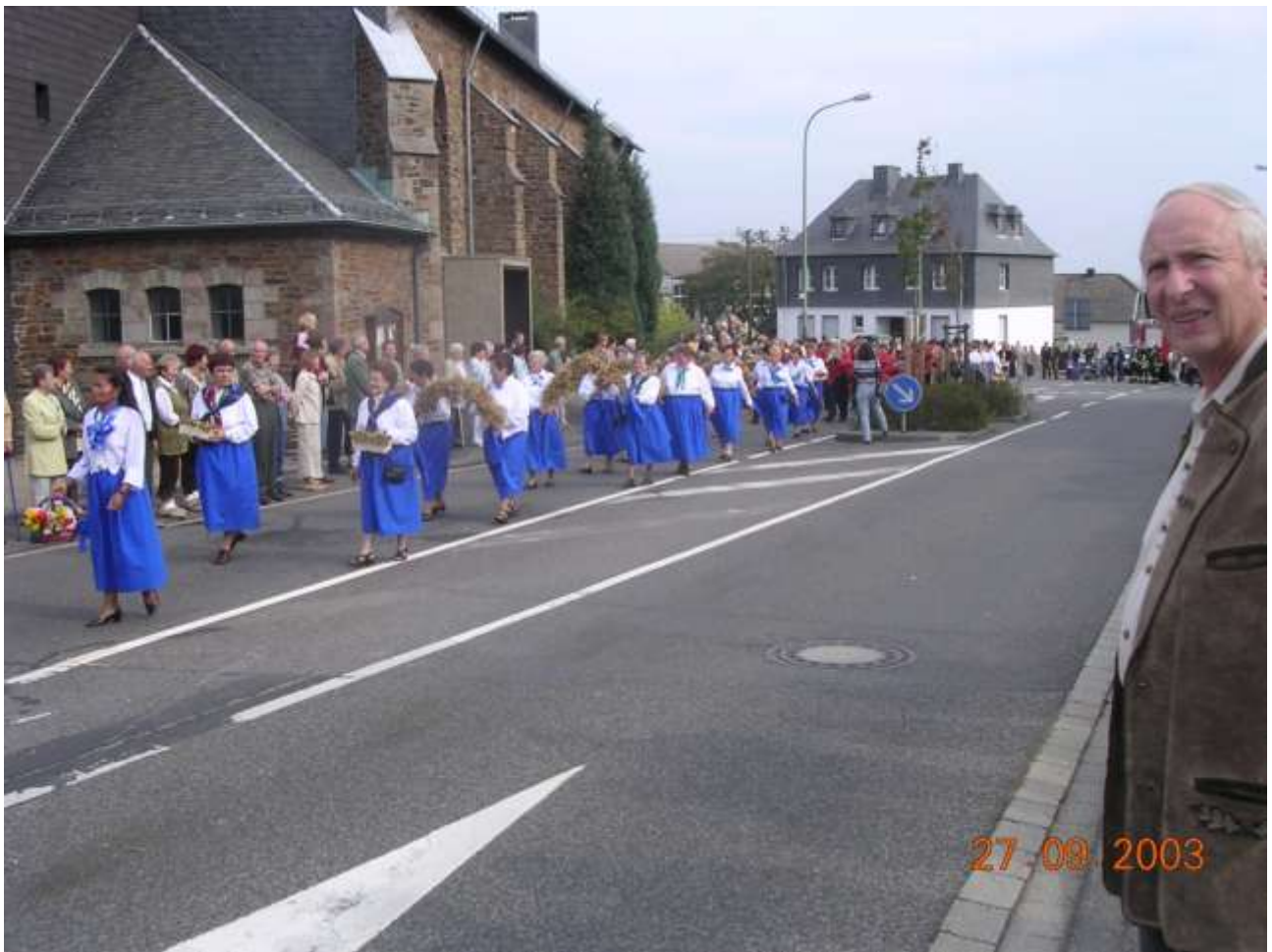
Oben: Kirche und Gemeindehaus / Church and Common House Unten: Kommerscheidt heute/ Kommerscheidt today