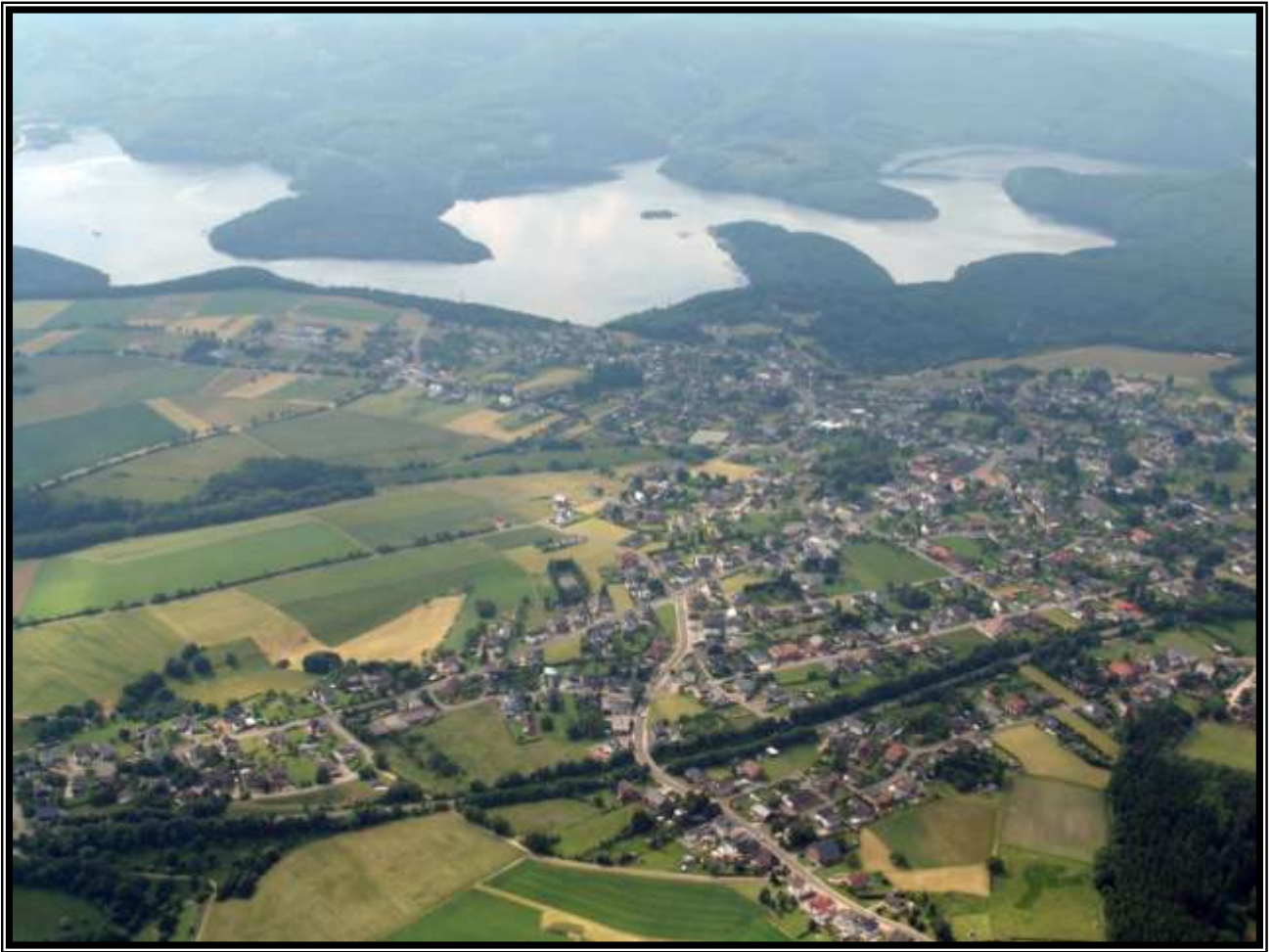
Blick auf Schmidt und den Rursee heute/ View of Schmidt and the Rursee today