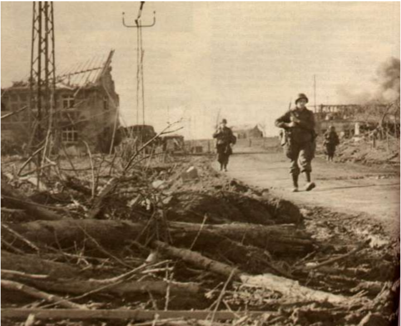
Blick auf die Monschauer Straße am 8. Februar 1945. Amerikanische Soldaten kommen die Straße herab Richtung Kirche. (Teilansicht, ganzes Foto Seite 7).

You have a look upon the Monschauer street on February 8., 1945. American soldiers walking towards the church. (Part of the picture, the whole picture you find on page 7).