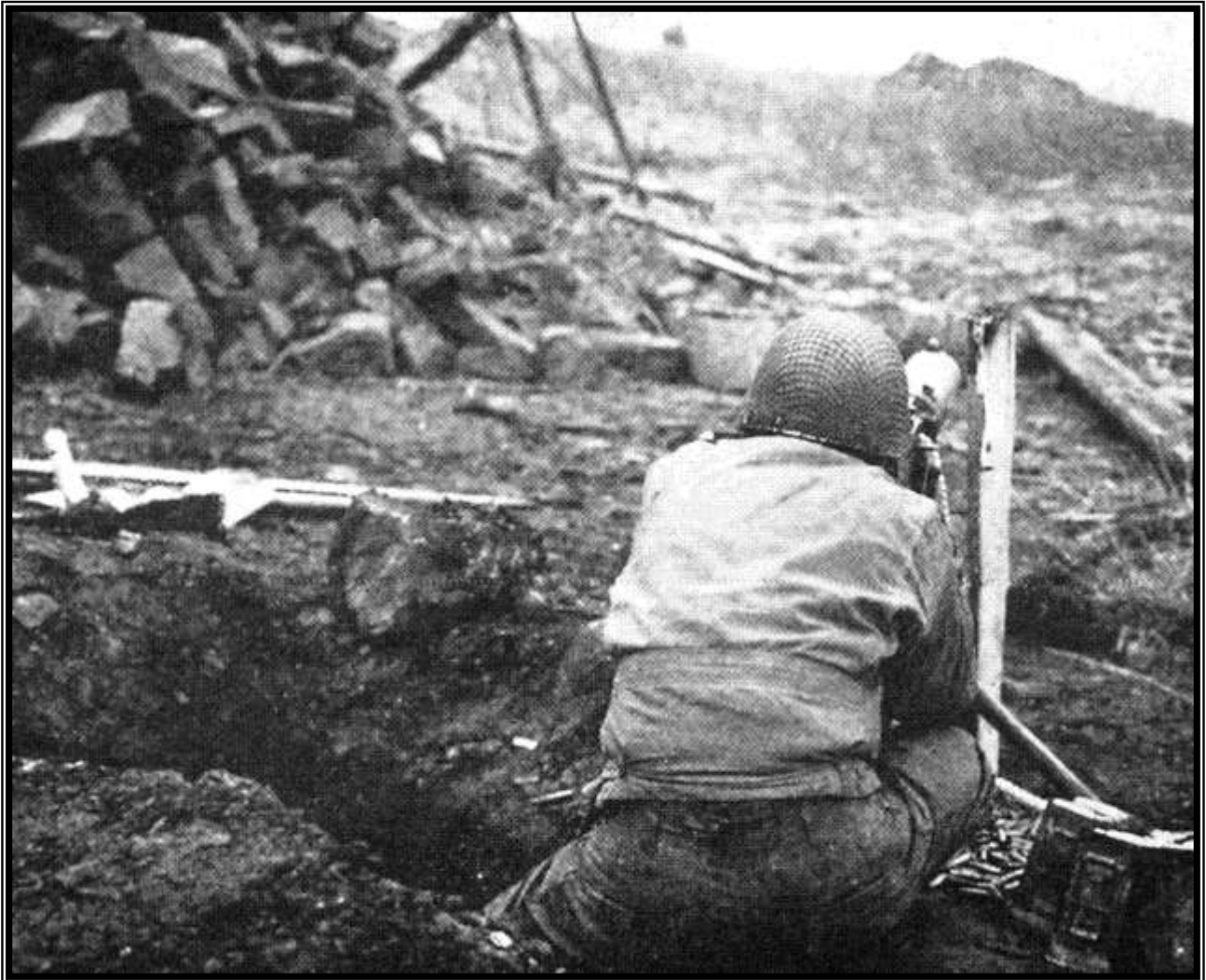
Amerikanischer MG-Schütze in Schmidt American MG-Gunner in Schmidt.