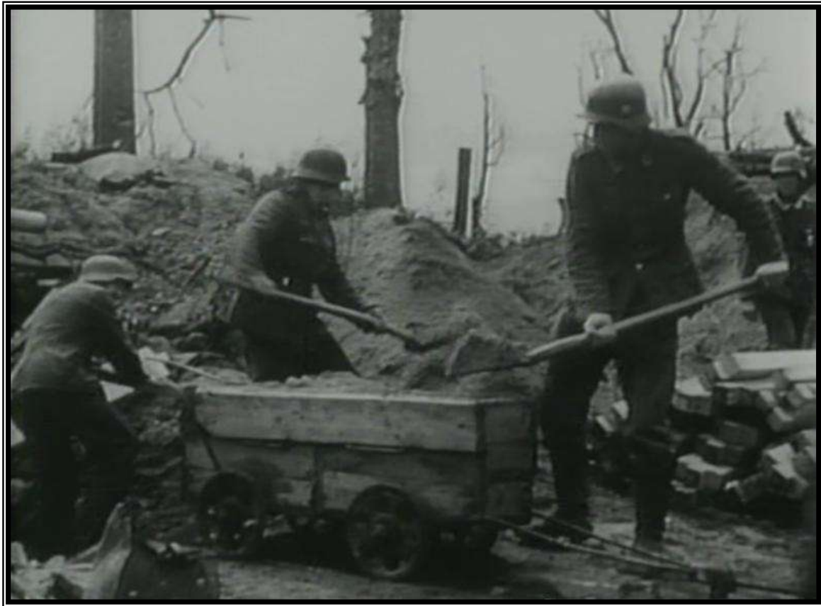
Deutsche Soldaten in Schmidt German Soldiers in Schmidt

once were barns. The roads were muddy, pocked with gaping craters, filled with mud and water. (Aus: Lightning, The History of the 78 th Infantry Division, Nashville, Tennessee 2000)