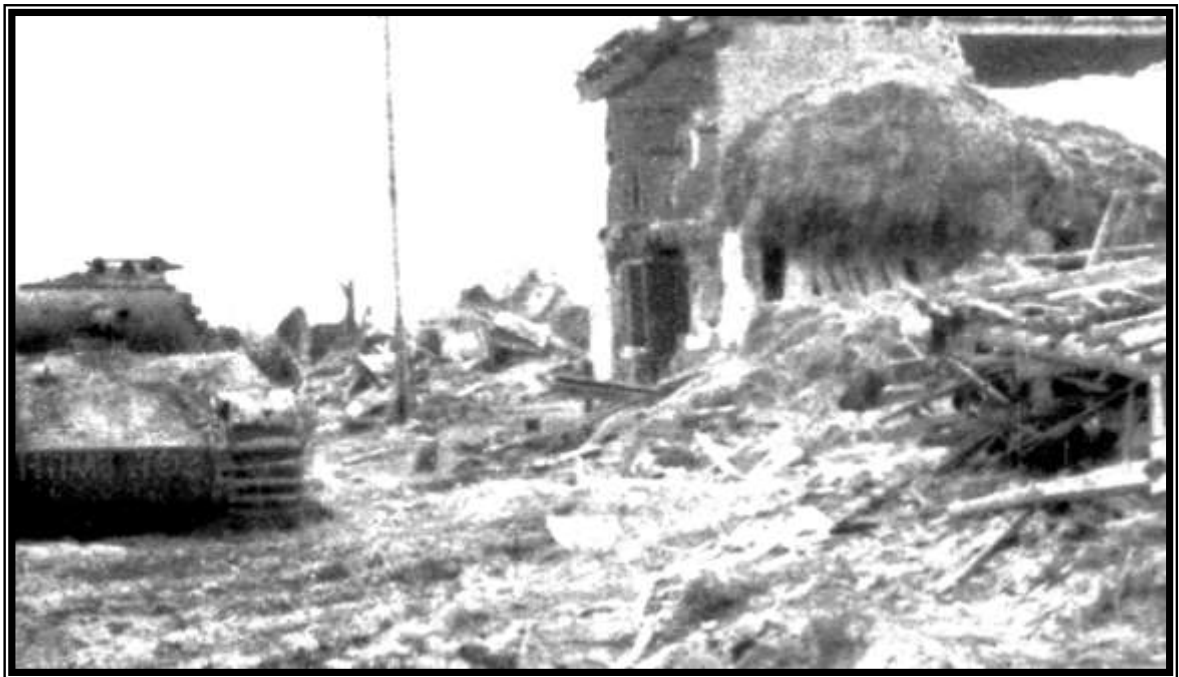
Zerstörter Panzer in den Trümmern von Kommerscheidt Destroyed Tank in the Ruins of Kommerscheidt