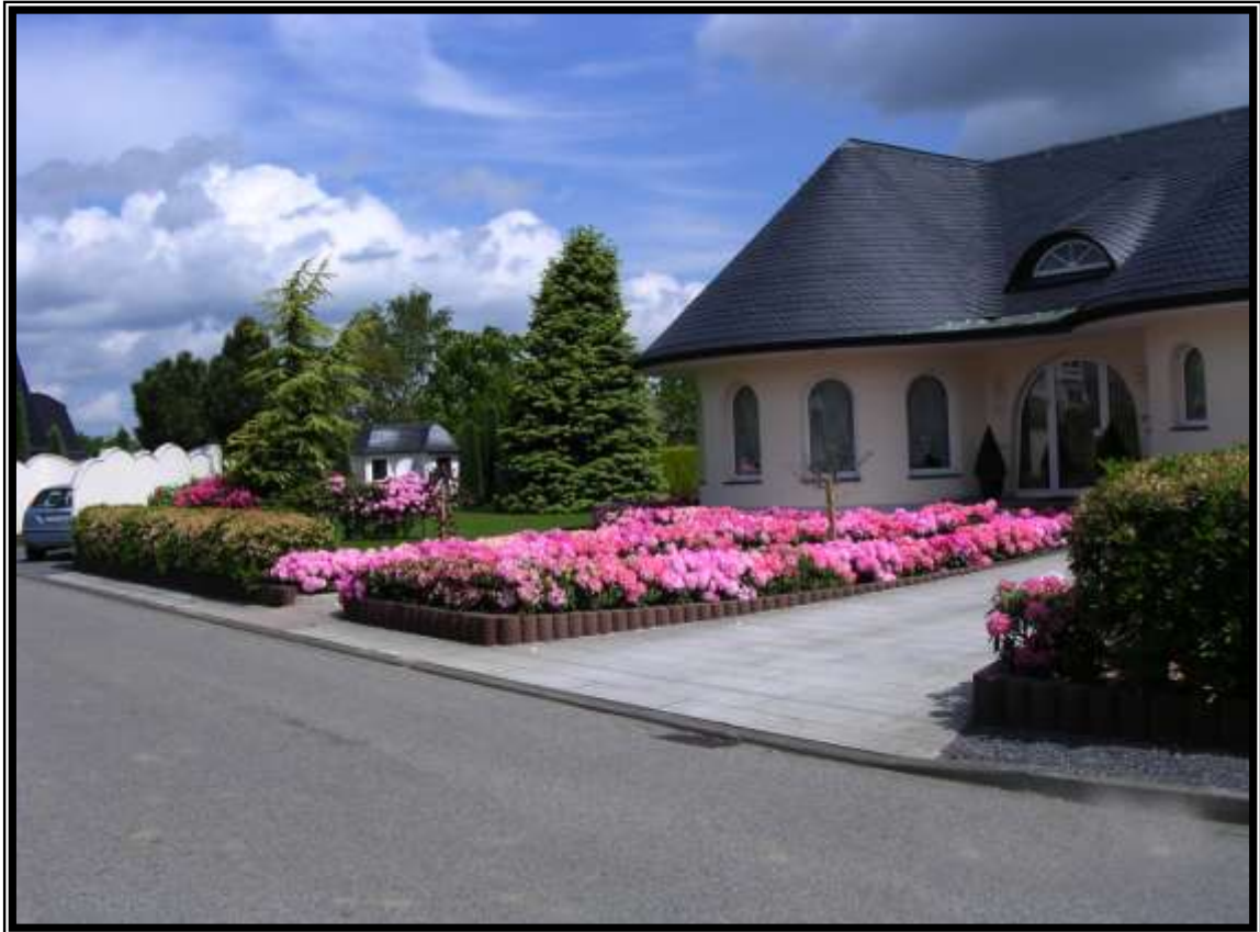
Oben: Blick auf Kirche und Schule/View upon Church and School Unten : Haus in der Vogtstraße/House in Vogtstraße