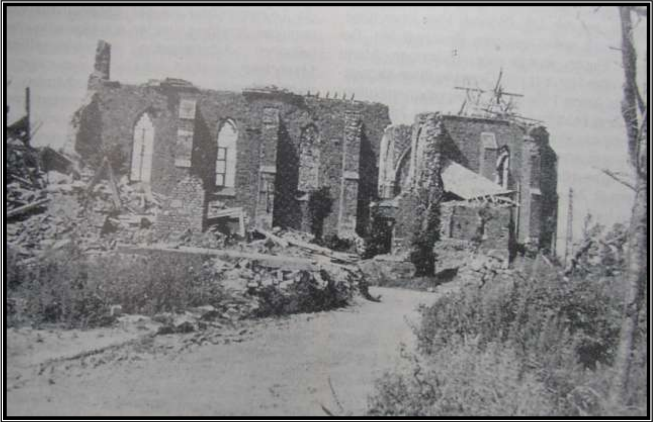
Destroyed Church in Schmidt