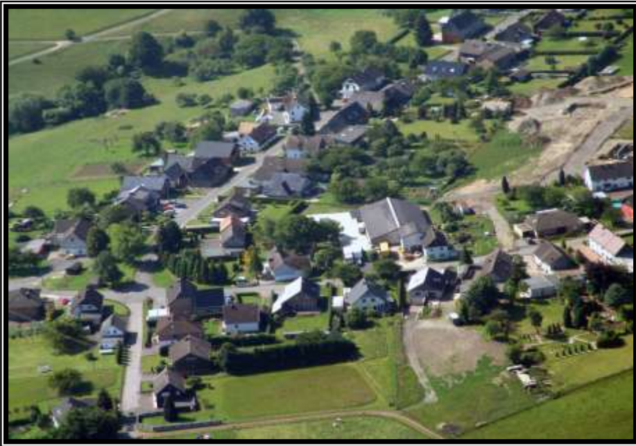
Blick auf Schmidt und Kommerscheidt/ View of Schmidt and Kommerscheidt